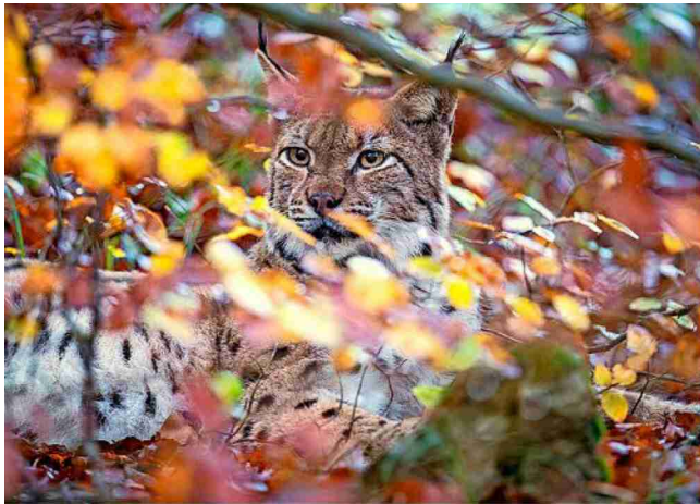
Le lynx se fige dès qu'il sent une menace, au contraire du loup qui, en fuyant, se laisse repérer.

Ordre: 1074342 Référence: 82190439 N° de thème: 832.064 Coupure Page: 2/3