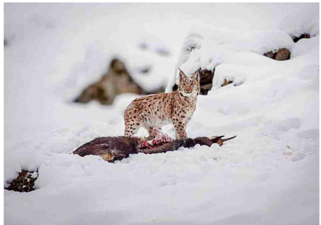
Les gardes forestiers apprécient ce prédateur qui régule la faune sans céder au carnage. LAURENT GISLIN